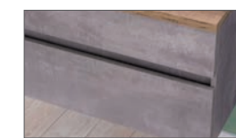
Griffprofil in Korpusdekor